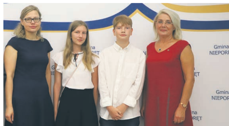
Szkoły Podstawowa im. Bohaterów Bitwy Warszawskiej 1920 r. w Stanisławowie Pierwszym