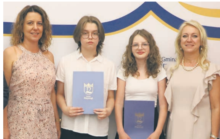
Szkoła Podstawowa im. Bronisława Tokaja w Nieporęciu