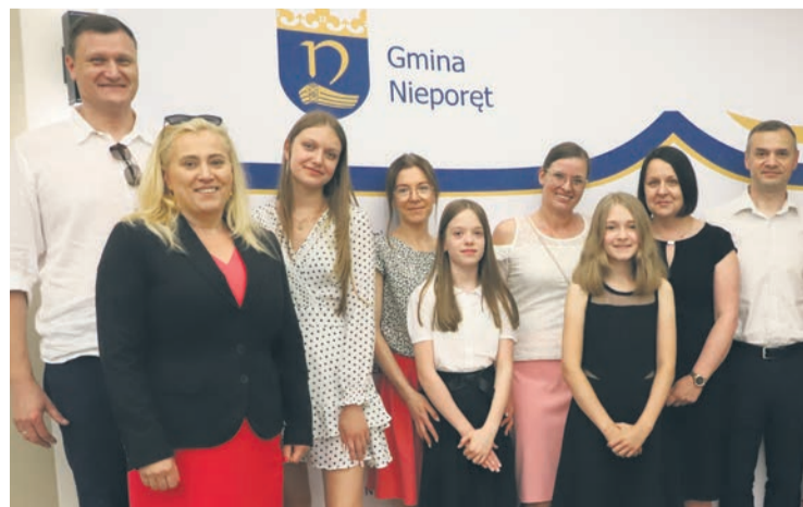
Szkoła Podstawowa im. Wandy Chotomskiej w Józefowie

Nasze gminne placówki oświatowe mogą poszczycić się także wyjątkowo dużą liczbą świadectw z czerwonym paskiem. W tym roku było ich aż 516! Oznacza to, że ponad połowa wszystkich uczniów