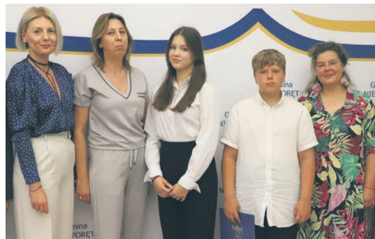
Szkoła Podstawowa im. 28 Pułku Strzelców Kaniowskich w Wólce Radzymińskiej