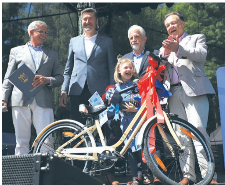
Nagroda główna w konkursie „Zegrzyńska Paskuda”

Równoległe z artystycznymi występami, na rozległym terenie kompleksu, rozgrywane były zawody sportowe. Na nieporęckim skateparku zorganizowane zostały zawody w jeździe na hulajnodze i deskorolce. Od rana na boisku do