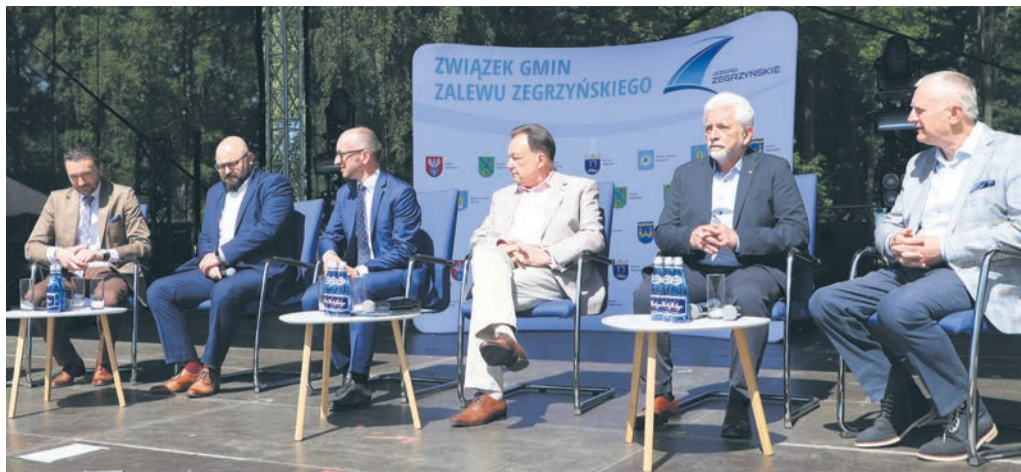
Panel dyskusyjny z udziałem samorządowców