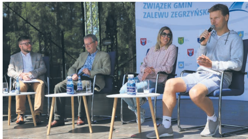
Panel z udziałem sportowców i naukowców