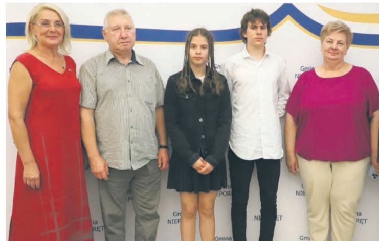
Szkoła Podstawowa im. Wojska Polskiego w Białobrzegach