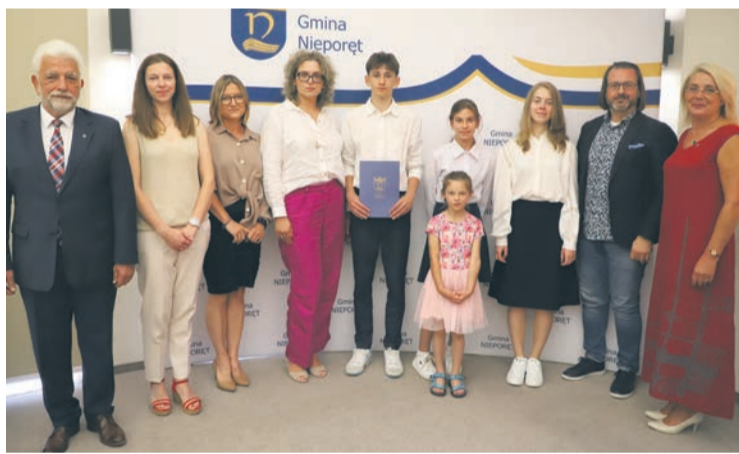
Szkoła Podstawowa im. I Batalionu Saperów Kościuszkowskich w Izabelinie

Wszystkim uczniom życzymy przyjemnych, bezstroskich i bezpiecznych wakacji, a kadrze pedagogicznej zasłużonego odpoczynku. □ AM