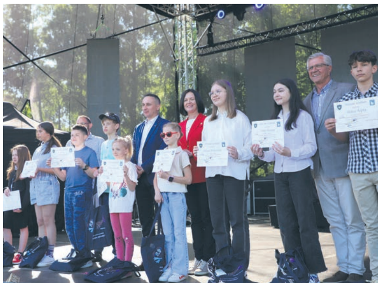
Laureaci konkursu ortograficznego