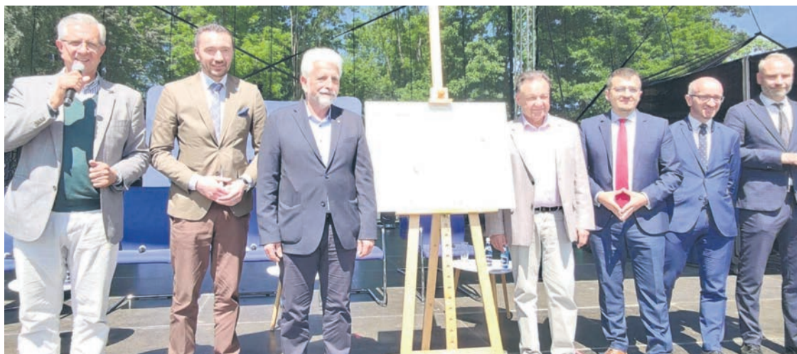
Uroczyste podpisanie porozumienia w sprawie utworzenia ścieżek rowerowych wokół Jeziora Zegrzyńskiego